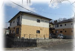
笠岡市大井南付近